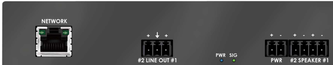
Rückseite AV25-2 NET