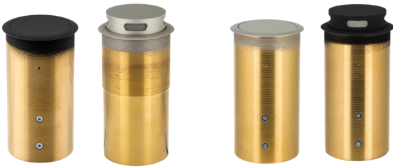
CRM 202-RF CRM 202N-RF CRM 203N-RF CRM 203-RF

Die CRM 200-RF-Serie besteht aus versenkbaren Zwei- und Dreikapsel-Tischeinbaumikrofonen. Die Kapseln besitzen jeweils Halbnierencharakteristik. Die Mikrofone wurden dafür konzipiert, in der Mitte eines Tisches eingebaut zu werden. So können die Gesprächsteilnehmer an mehreren Seiten des Tisches erfasst werden.